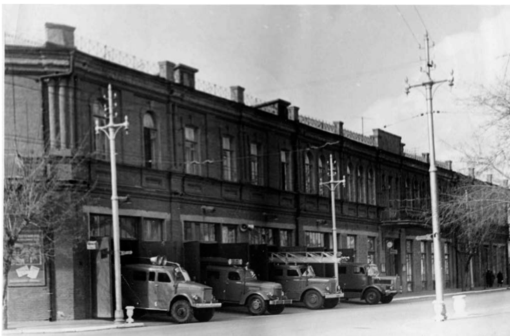
Восстановленное здание УПО НКВД Краснодарского края после войны

Председатели райисполкомов в сельской местности обязаны были восстановить ранее существующие межколхозные и колхозные пожарные дружины, и совместно с районными пожарными инспекторами разработать дислокацию пожарных дружин по населенным пунктам, с указанием насосных и конно-бочечных ходов, людей и лошадей.