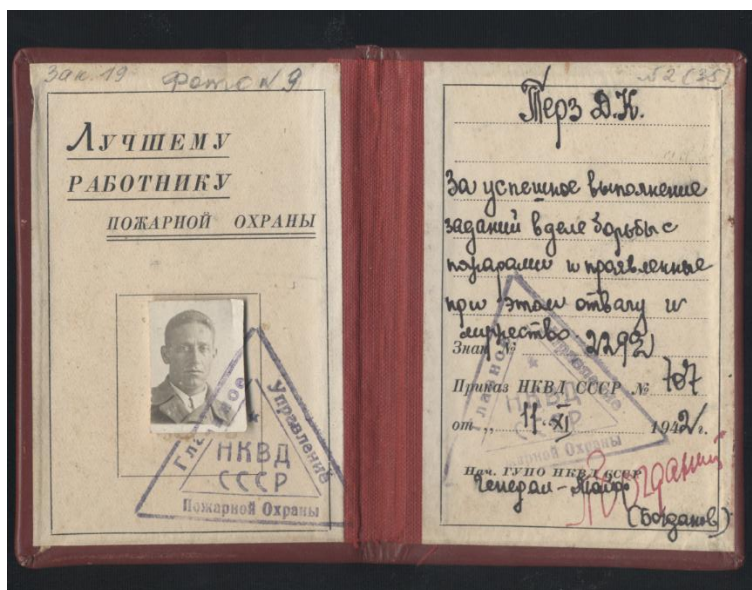
Удостоверение Д.К.Терз к нагрудному знаку «Лучшему работнику пожарной охраны»

Вскоре на одном из резервуаров удалось погасить пламя и приступить к охлаждению его корпуса, это стало возможным благодаря мужеству пожарного Д.К. Терза. Обливаемый водными струями, он поднялся по трапу на крышу резервуара, кошмой закрыл отверстие, откуда полыхало пламя.