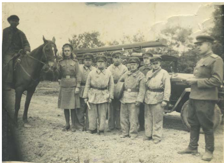
Работа пожарных команд в сельских районах Кубани

С 25 апреля по 25 мая 1944 года в Кушевском районе проводился месячник по подготовке пожарной охраны к весенне-летнему периоду. На этот период в населенных пунктах района были созданы противопожарные тройки. Они систематически заслушивали руководителей о противопожарном состоянии их объектов. Было принято решение исполкома Райсовета депутатов трудящихся «О мероприятиях по охране урожая от пожаров».