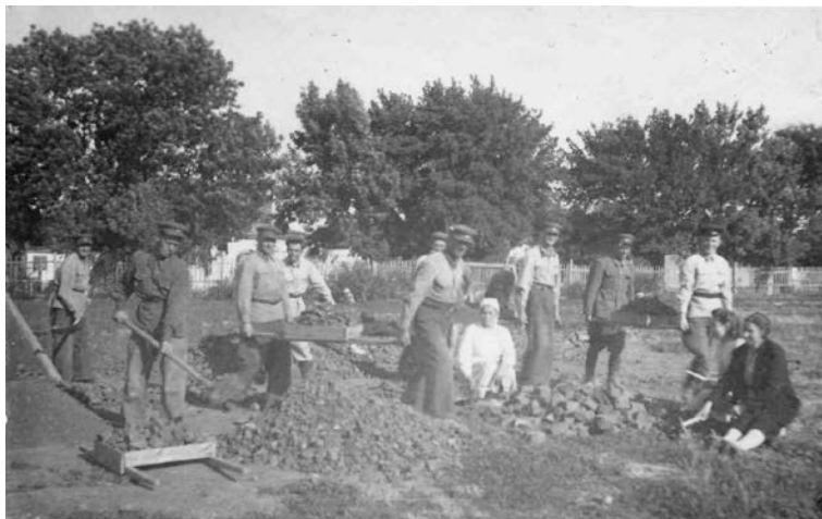
Работа по восстановлению народного хозяйства