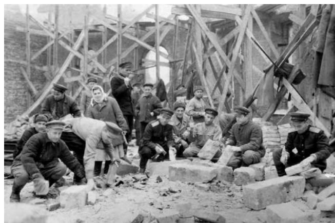
Разрушенное здание УПО НКВД Краснодарского края, восстановительные работы, 1943 год